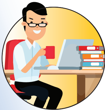
TESTEN | CODEREN

Neem contact op met je contactpersoon bij UWV, de gemeente of meld je direct aan via www.bee-ideas.com en vul het 'start nu' formulier in.